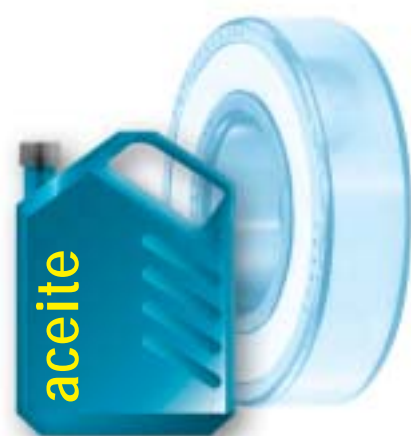
Cantidad de aceite contenida en un rodamiento con LubSolid.

Por su concepto de base, la LubSolid no puede ser expulsada y alimenta de aceite sin interrupción los puntos críticos del rodamiento. Esto permite suprimir todos los tiempos de parada y los reengrases.