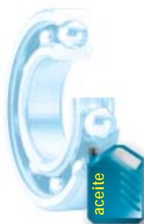
Cantidad de aceite contenida en un rodamiento engrasado.

Bajo el efecto de las sollicitaciones mecánicas y térmicas, la grasa es laminada y expulsada de la zona de contacto entre cuerpo rodante / pista de rodadura. Esta pérdida impone reengrases frecuentes.