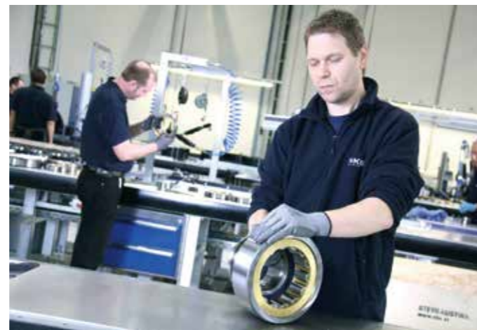
Sede central de NKE en Steyr, Austria - más de 10.000 m 2 para las funciones principales como Ingeniería, Producción, Control de calidad, Logística, Comercialización y Distribución.