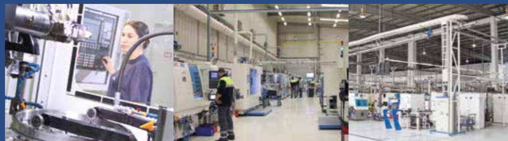
NKE Steyr, Austria